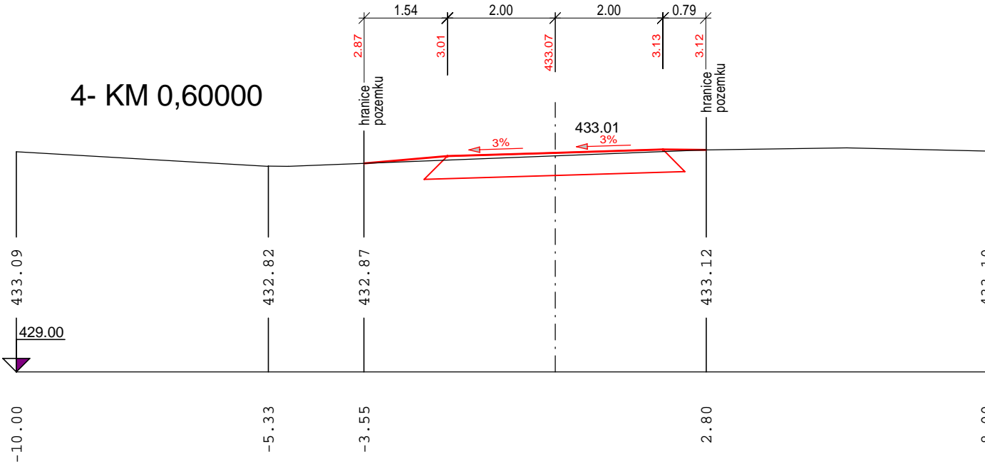
4- KM 0,60000